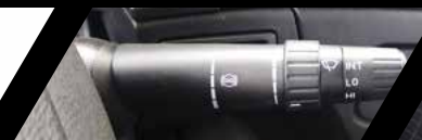
Freno de motor + Retardador