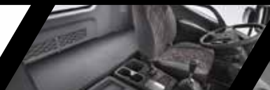
Cabina con protección anticorrosiva