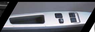
Vidrios eléctricos delanteros