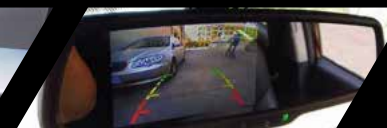
Cámara y sensor de retro