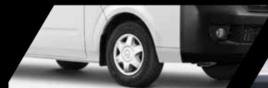
Frenos ABS + EBD