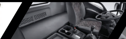
Cabina con protección anticorrosiva