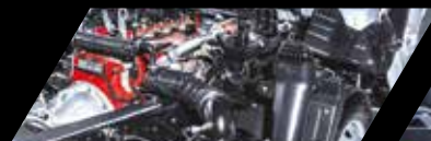
Motor Cummins ISF