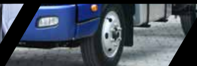
Frenos ABS + EBD