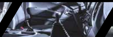
Caja ZF de 6 velocidades