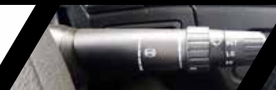
Freno de motor + Retardador