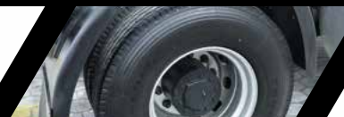
Eje con cubos reductores