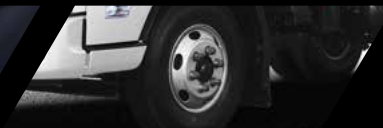
Frenos ABS + EBD