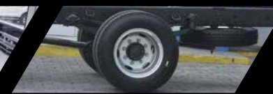
Medida de llanta: R22.5