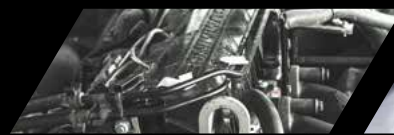
Motor Cummins ISF