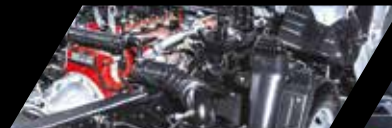
Motor Cummins ISF