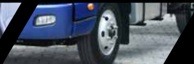
Frenos ABS + EBD